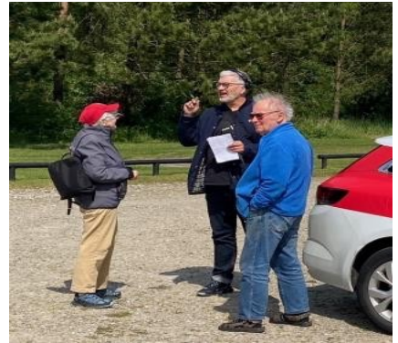
Interview med DR Midt Vest P4 til "Gæt hvor jeg står".

Byggeriet af møllen startede i 1975, og da den blev klar til at producere strøm i 1978, var den verdens største vind kraftværk. Siden da har møllen i Tvind været et symbol på potentialet i brug af vedvarende energi fra lokale møller, og et argument imod nødvendigheden af at indføre atomkraft i Danmark. Det er der stadig brug for.